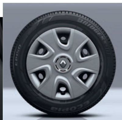
Stalowe obręcze kół 15", wzór Extreme